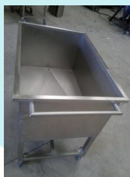
Carro bañera para jamones