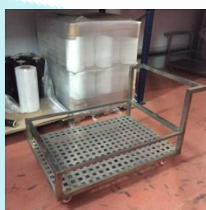
Transporte bobinas y recipientes limpieza

Para más información contacte con: Soltec-Esvi 46138 Rafenbunyol, Valencia ventas@soltec-esvi.com 961411334