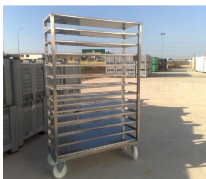
Para transporte y congelado