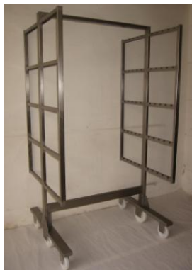
Para chorizo sarta. Encastrable

Fabricado con acero inoxidable AISI 304, aportación de soldadura en Aisi 316, acabado arenado.