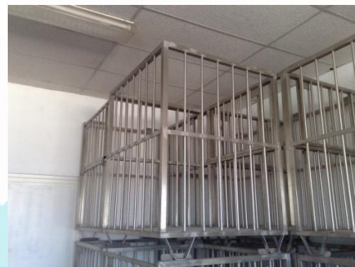
Para almacenaje curado y congelado